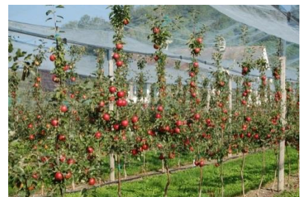
‚Ladina‘ wächst mittelstark und trägt regelmäßig. Die Fruchtfärbung setzt früh ein.