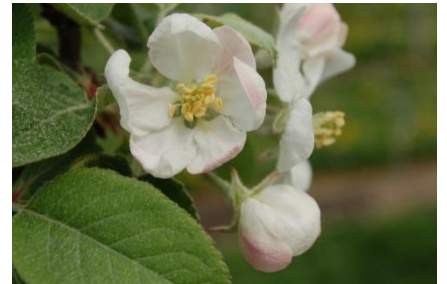
Blüten der Sorte Ladina.

Sehr gute Lagerfähigkeit auch bei tieferen Lagertemperaturen. Geringer Festigkeits- und Säureabbau. Neigung zu Hautflecken (superficial scald) bei längerer Lagerung und Nachlagerung.